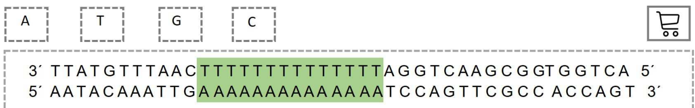
Abbildung erstellt durch Frank Harder, ZPG Biologie

Die DNA, die für die homologe Rekombination bestellt wurde , besitzt homologe Bereiche, die denen der Bereiche um die Schnittstelle herum entsprechen (homologe Randbereiche). Da die Spleißstelle vor Exon-5 für die Spleißenzyme nicht mehr erkennbar sein darf, ist dieser Bereich durch Einfügen einer stark abgeänderten Basensequenz unkenntlich gemacht.