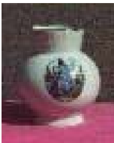
Kugelvase aus Porzellan