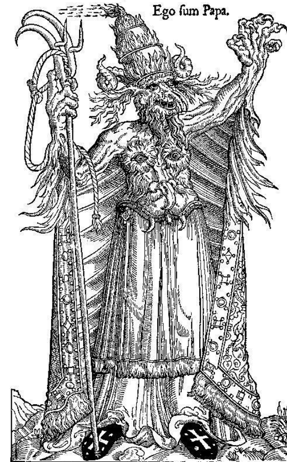
Flugblatt mit dem Titel „Ego sum Papa.“ (dt.: Ich bin der Papst.)