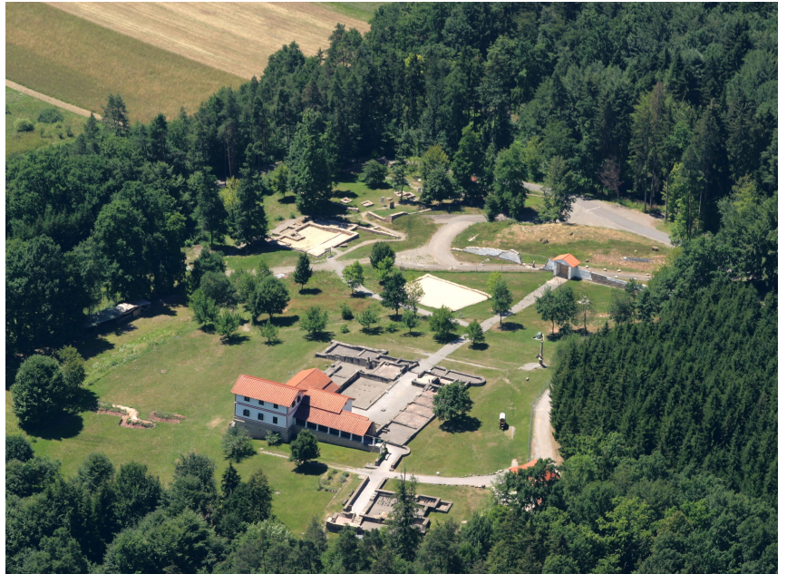
B 1 Luftbild – Gesamtanlage des Freilichtmuseums