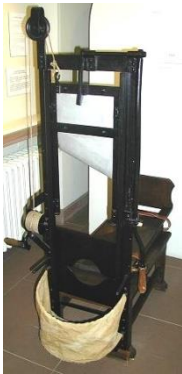
„Badische Guillotine“ von Thomas Ihle - Eigenes Werk by Thomas Ihle. Lizenziert unter CC BY-SA 3.0 über Wikimedia Commons - https://commons.wikimedia.org/wiki/File:Badische_Guillotine.JPG#/media/File:Badische_Guillotine.JPG

Einstieg: Ziele der Verfassung von 1793 notieren (Freiheit, Gleichheit, Brüderlichkeit). Bild von einer Guillotine zeigen („Wisst ihr, was das ist? Wozu diente es?“) und Verfassungsziele mit Daten aus der Phase der terreur kontrastieren (Anzahl der Hinrichtungen 1793/94). Ergänzt wird der Impuls an der Tafel mit dem Hinweis, dass ca. 86% der Hingerichteten dem 3. Stand angehörten. Dieser Impuls soll die SuS dazu animieren, Fragen zu stellen, die im weiteren Verlauf beantwortet werden. (vgl. Schwerpunkt Fragekompetenz) Die Leitfrage lautet: „ Durch Gewalt zu Freiheit und Demokratie? “