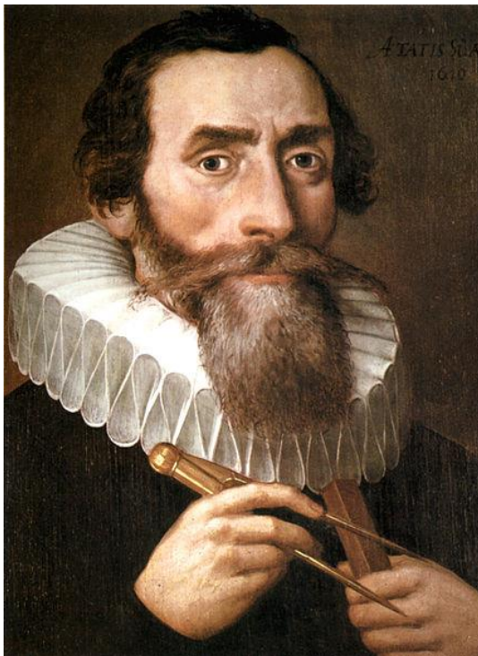
Abbildung 2: Johannes Kepler

Das erste Kepler'sche Gesetz beinhaltet die Näherung, dass das jeweilige Zentralgestirn im Brennpunkt der Ellipse so massereich ist, dass es durch die Anziehungskraft des umlaufenden Himmelskörpers nicht abgelenkt wird.