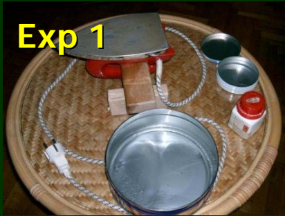
„Die Sonnenoberfläche in der Keksdose“