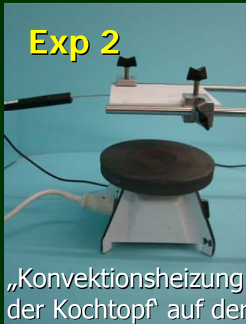
„Konvektionsheizung – der Kochtopf auf der Sonne“