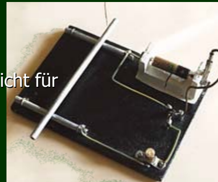
Exp 4 „Fritter – nicht für Kartoffeln“