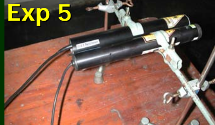
„Wellenoptik und das Auflösungs- vermögen von Teleskopen“