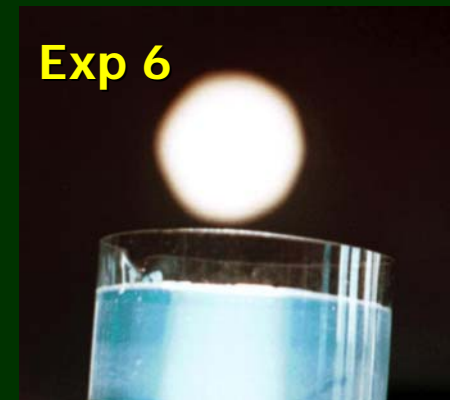
„Himmel im Wasserglas“