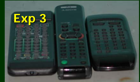
„Allwellenastronomie – IR-Strahlung in der Digitalkamera“