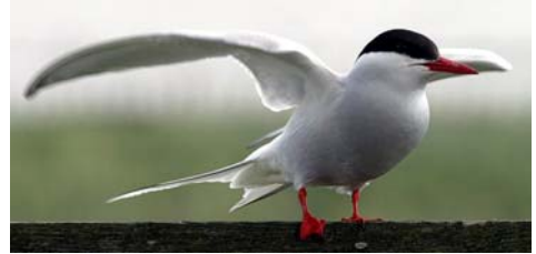
Küstenseeschwalbe ( Sterna paradisaea )