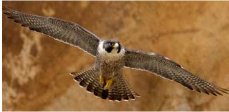
Wanderfalke ( Falco peregrinus )

Die Vögel sind die „Könige“ der Lüfte. Sie sind an ihren Lebensraum Luft optimal angepasst. Unter Ihnen gibt es wahre Weltrekordhalter, z. B. Mauersegler, Wanderfalke und Küstenseeschwalbe.