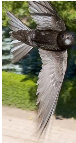
Mauersegler ( Apus apus )