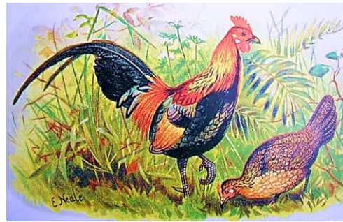
Bankivahahn und -henne

In den Wäldern Südostasiens findet man die wild lebenden Bankivahühner. In einer kleinen Gruppe lebt je ein Hahn mit fünf bis zwölf Hennen zusammen. Die „Hackordnung“ weist jedem Gruppenmitglied eine eigene Rolle (Rang) zu. Mit Lauten und Blickkontakt stehen die Hühner ständig in Verbindung zueinander. Der Bankivahuhn-Tag beginnt mit dem Hahnenschrei.