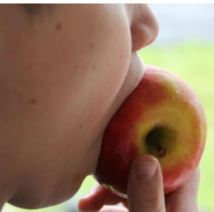
Beim Essen