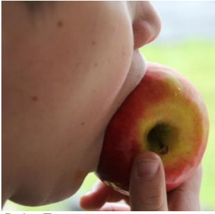
Beim Essen