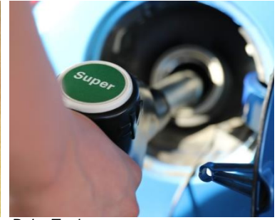
Beim Tanken