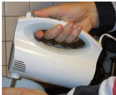
Rührgerät (C.-J. Pardall)