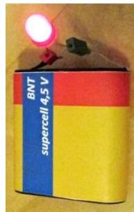
Leuchtdiode - LED (C.-J. Pardall)