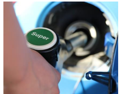
Beim Tanken