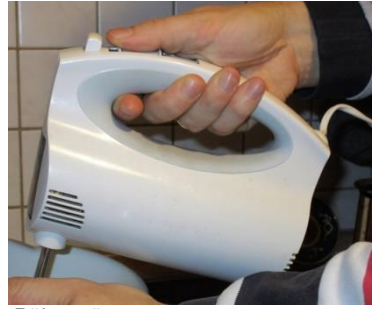
Rührgerät (C.-J. Pardall)