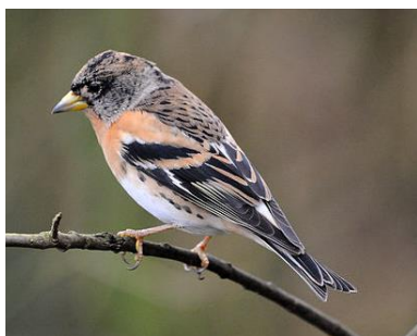
Bergfink (Männchen, Winterkleid)