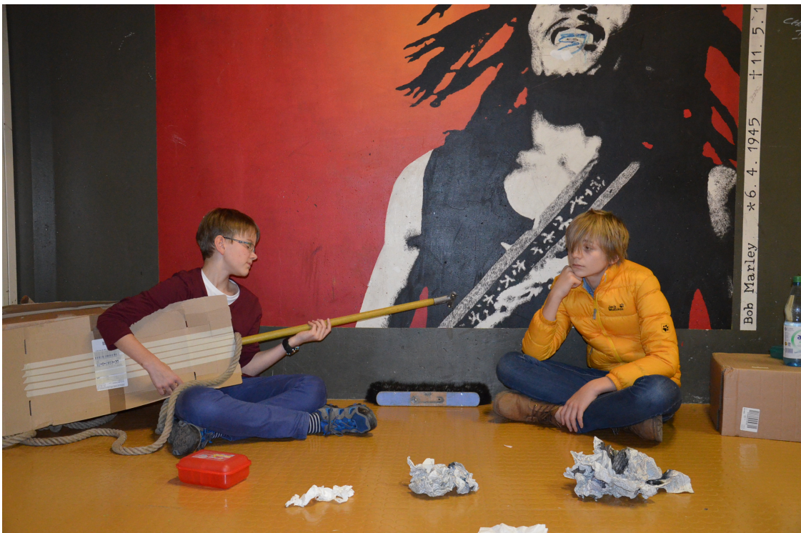
Jeff Wall, „Der Gitarrist“, Bildquelle: ZPG Sek1 BK _