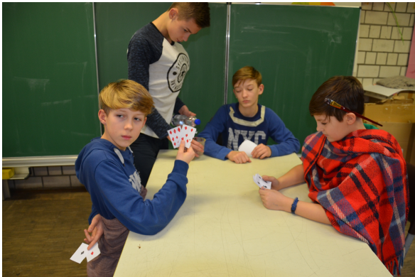
Georges de la Tour, „Der Falschspieler mit dem Karo-As“

Die gespielte Szene wird in Form einer Fotostory (in 4 Bildern) oder als Film festgehalten.