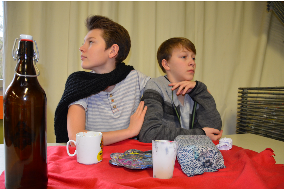
Pablo Picasso, „Das karge Mahl“