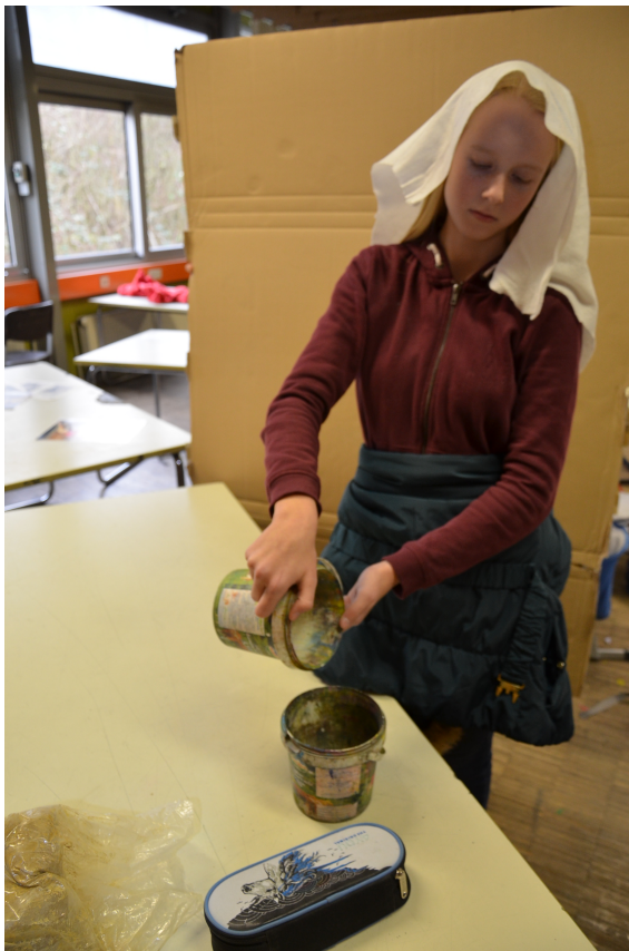
Jan Vermeer van Delft: „Die Küchenmagd“