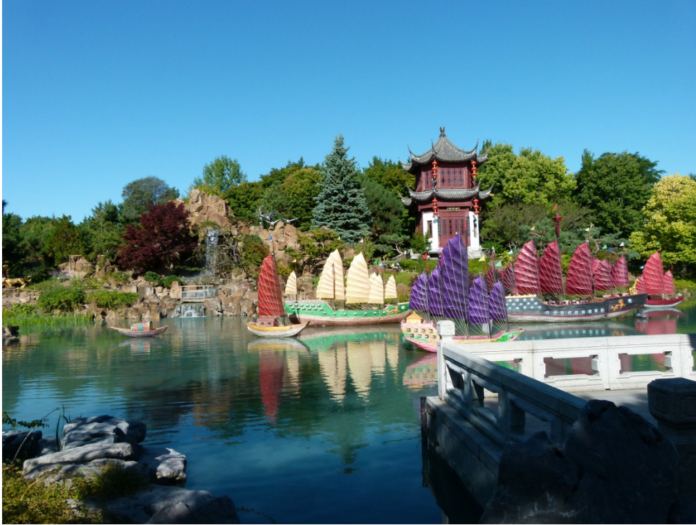
Le Jardin Botanique