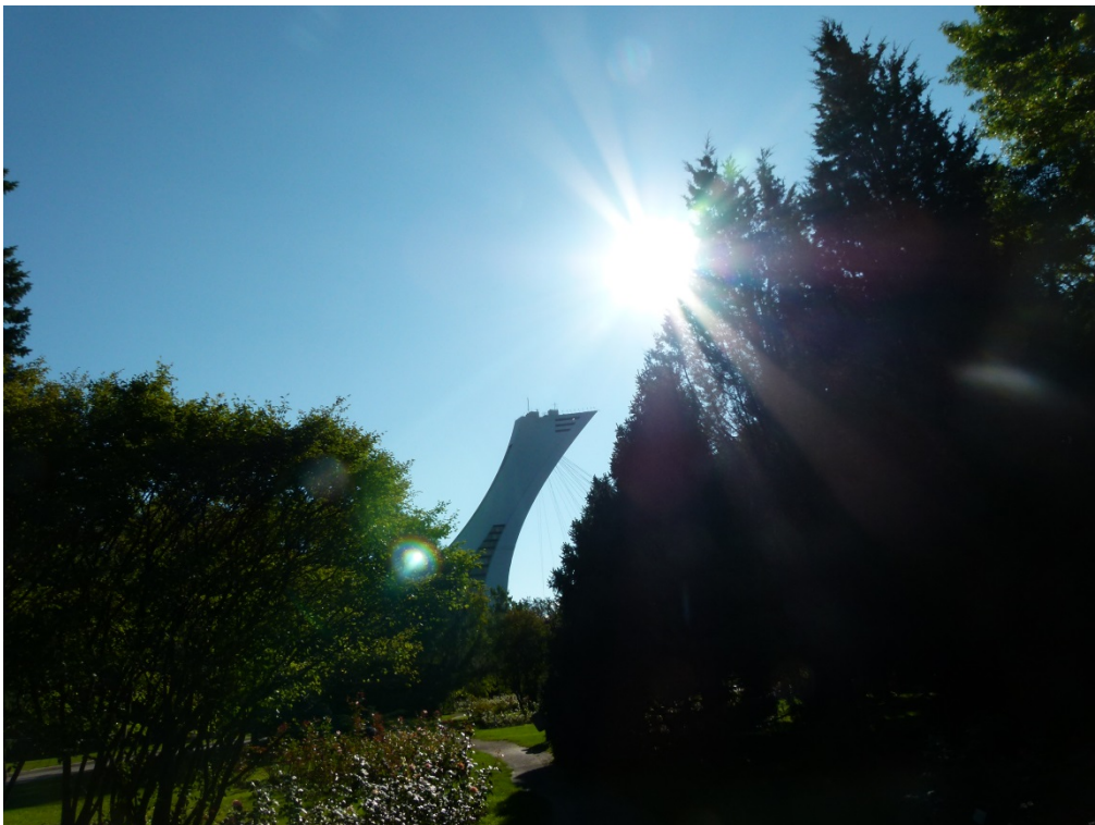
Le Stade Olympique