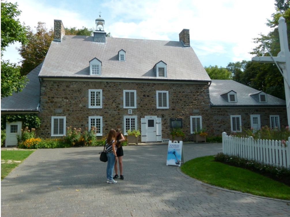
La Maison St. Gabriel